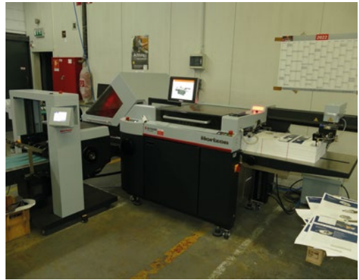
Eine Kombifalzmaschine der neuesten Generation: der Horizon iCE Folder AFV-56K.