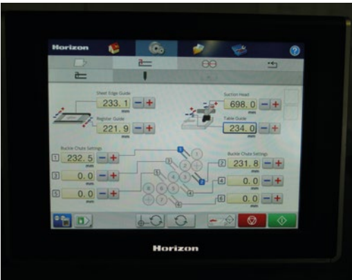
Den Horizon iCE Folder AFV-56K zeichnet eine klare Bedienerführung aus.

gestaltet werden. Im Zuge dieses Neubaus wurde stark in den Druck und in die Weiterverarbeitung investiert. Im Offsetdruck produziert Silber Druck mit Achtfarben- und Zehnfarben-Maschinen (insgesamt 26 Druck- und zwei Lackwerke) von Koenig & Bauer. In der Weiterverarbeitung laufen ein Klebender mit 16 Stationen, ein Sammelhefter, acht Falzmaschinen sowie zwei Schneidsysteme.