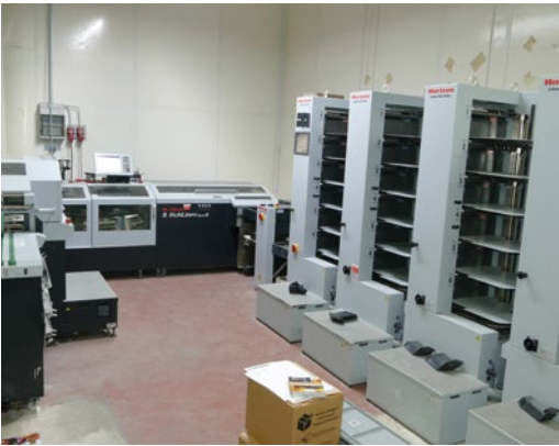
Einer der zwei StitchLiner Mark III mit mehreren Einzelblatt--Zusammentragmaschinen.