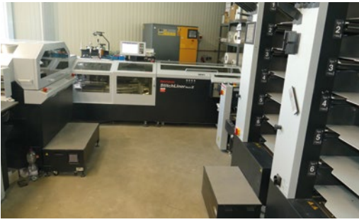
Der Horizon StitchLiner Mark III und rechts die Zusatztürme mit Vollausrüstung.